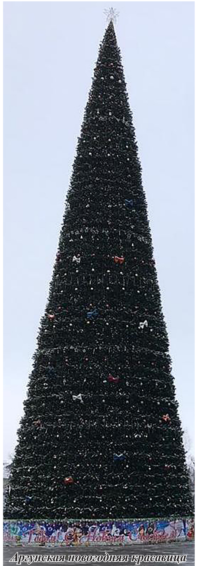
Аргунская новогодняя красавица

Хьарг!- гамо длаьлла барт тлеттла члаглуш, Дехийла нохчийн къам дъуне мел лаьтта. Тлаьхарчу тлаьхьенна кхин цкъа а вон ца гуш, Беркате хуьлийла дай бахъна латта.