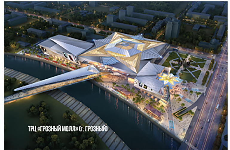
ТРЦ «ГРОЗНЫЙ МОЛЛ» г. ГРОЗНЫЙ

Для строительства ТРЦ «Грозный-молл», на заводе «Теплостройпроект-С» было изготовлено 4 500 тонн металлоконструкций. Строительство объекта началось в 2017 году, а основные строительные-монтажные работы практически завершены. Об этом сообщает пресс-служба холдинга RIMGROUP.