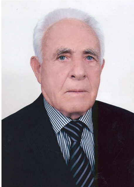
Иза-м цхьа гюьга яй, Лаца тлам бацахь, Ойламо литтина, Цандина дацахь...

Матто шен эшарехь Керчадеш говза, – Кийрара хецалой, Дош долу ловза. –