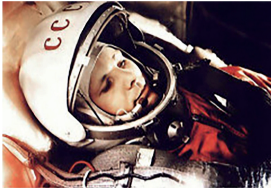
Юрий Алексеевич Гагарин

На высоте нескольких километров от поверхности Земли, в соответствии с намеченной программой, космонавт катапультировался и совершил посадку на парашюте вблизи спускаемого аппарата. Гагарин приземлился в 10 часов 55 минут по местному времени на мягкую пашню у берега Волги вблизи деревни