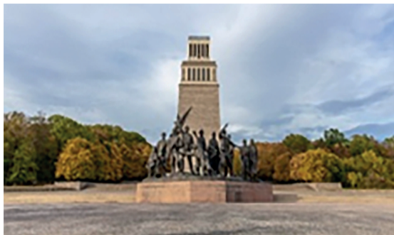
Памятник жертвам Бухенвальда

сдаче заключенными имеющегося у них оружия. Батальон советских военнопленных отказался сдать оружие, поскольку оно является единственным доказательством проведенного в лагере вооруженного освободительного восстания. Батальон продолжил свое существование как самостоятельная войсковая единица.