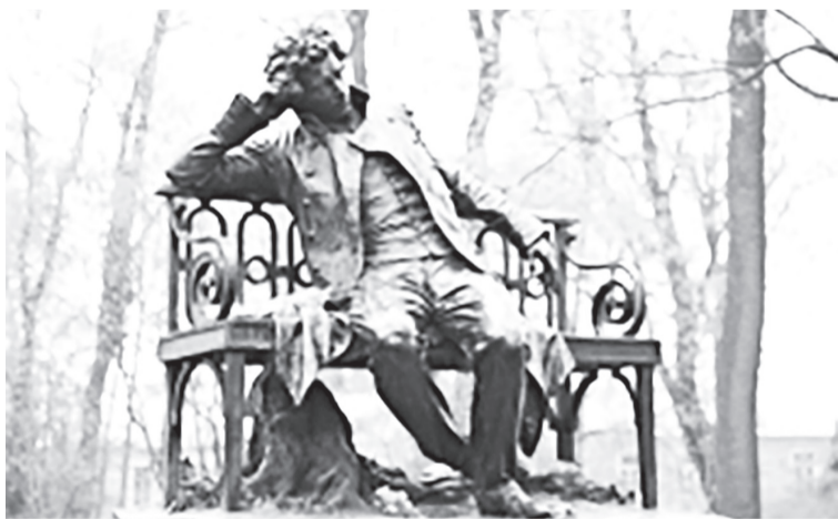
Памятник А.С. Пушкину в Царском селе

веданий, национальностей, переводятся на десятки языков мира.