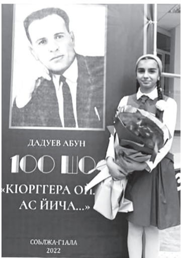
Дадуев Абу клант Мохьмадан йоблан йо1 Мадаева Медина

Кхидерг ца дийцига а, хийрачу махкахъ 1955-чу шарахъ «Къинхьегаман байракх» цле йолу газета арахеца а, къам цладорззушехъ Сольжа-Глалахъ 1957-чу шеран 15-чу июлехъ «Ленинан некъ» газетан хьалхара номер аряккхар а товар дара нохчийн интеллигенцис гайтинчу хьуьнран мах хадо!