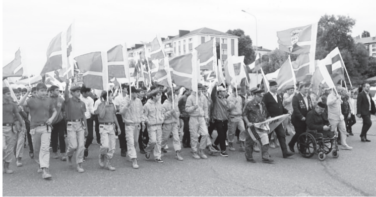
Аргун и завершили акцию А.А. Кадырова. в городском парке имени